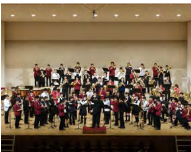
迫力ある生演奏をお楽しみください

解決をお手伝いする労働委員会をご利用ください。手続きは簡単・無料・秘密厳守です。 ▼問合せ 県労働委員会事務局 ☎048・830・6452