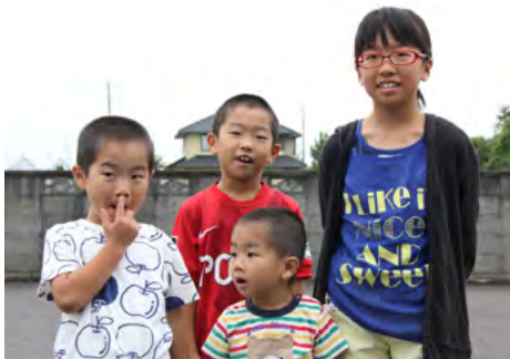
渋谷4兄弟は地域に見守られ、成長中です

「コツコツやってきたおかげで活動が根付いてきました。今や参加者にとっては生活習慣の一つ。地区外の人にも巻き込みながら続けていきたいです」