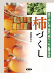
柿づくし 柿渋、干し柿、柿酢、 柿ジャム、紅葉保存 (浜崎貞弘)