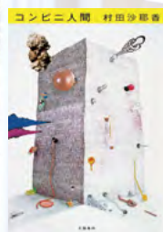
コンビニ人間 (村田沙耶香) ※芥川賞受賞作