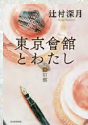
東京會館とわたし 上・下 (辻村深月)

「見習いの家裁調査官補」は、 先輩から親しみを込めて「カ ンポちゃん」と呼ばれる。「カ ンポちゃん」の望月大地は、 心を開かない相談者たちを相 手に、真実に辿り着くことが できるのか…。