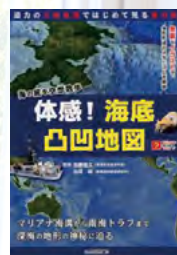
体感！海底凸凹地図 海の底を空想散歩 迫力の立 体地図ではじめて見る海の姿 (加藤義久/監修)