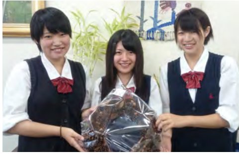
講師を務める羽生実業高校の生徒の皆さん