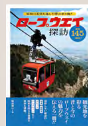
ロープウェイ探訪 昭和の希望を運んだ夢の 乗り物！国内 145 路線！ (松本晋一)