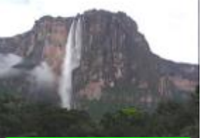
32 ベネズエラ、エンジェル・フォール