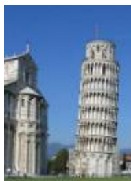
16 イタリア、ピサの斜塔