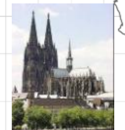
20 ドイツ、ケルン大聖堂