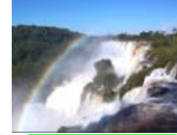
29 アルゼンチン、イグアスの滝