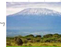
27 タンザニア、キリマンジェロ国立公園