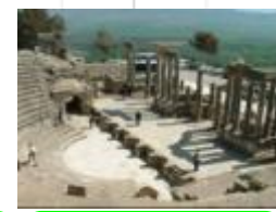
23 チュニジア、ドゥッガの古代劇場