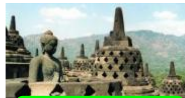
6 インドネシア、ボロブドゥール遺跡