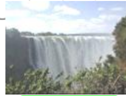
26 ジンバブエ、ヴィクトリアの滝