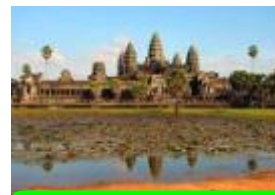
5 カンボジア、アンコール・ワット