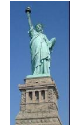
34 アメリカ、自由の女神像