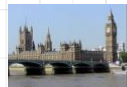
19 イギリス、ウエストミンスター宮殿