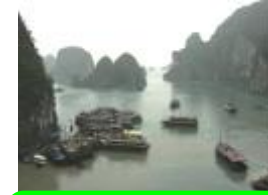
4 ベトナム、ハロン湾