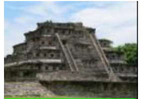
33 メキシコ、古代都市エル・タヒン