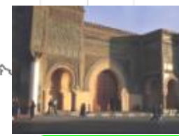
24 モロッコ、古都メクネス