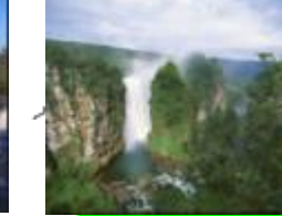
30 ボリビア、アルコ・イリスの滝