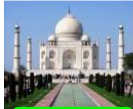
7 インド、タージマハル