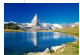
18 スイス、マッターホルン