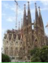
21 スペイン、サグラダファミリア