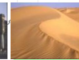
25 ニジェール、アイル・テネレ自然保護区