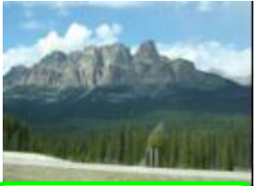
35 カナダ、カナディアン・ロッキー