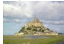
17 フランス、モンサンミッシェル