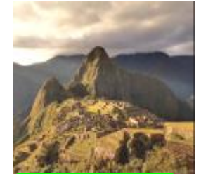
31 ペルー、マチュ・ピチュ