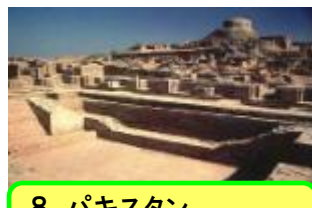
8 パキスタン、モヘンジョダロ