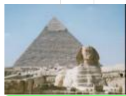
22 エジプト、スフィンクスとピラミッド