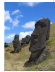
28 チリ、ラポ・ヌイ国立公園