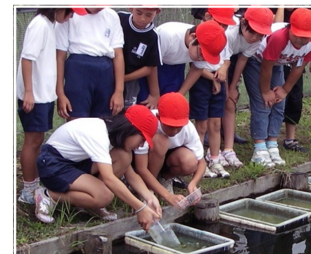
ムジナモ集会(ムジナモ放流)