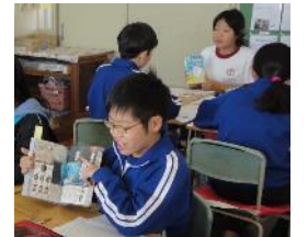
5年生ビブリオバトル

各学年の図書に関する国語の単元や並行読書の選定、古典学習の一環として、百人一首を行ったり、読書単元ではビブリオバトルを紹介したりするなど幅広い単元で学校図書館司書が積極的に授業に入り、専門性を生かしている。