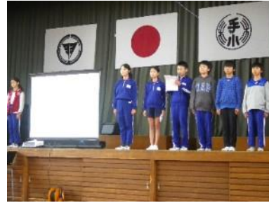
図書委員会による発表

言した。期間中は朝の活動を読書タイムに変更したり、土日の宿題に「家読」を出したりするなど、めあて達成に向けて、読書時間の確保を行った。めあてが達成できた児童には記録カードにシールを貼り努力を賞賛した。またクラス全員がめあてを達成できたら、廊下のクラス表示の下に認定証を貼り、成果が分かるような工夫を行った。全校で95%の児童が目標を達成した。