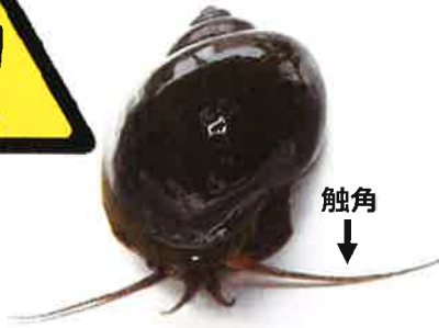
ジャンボタニシ (スクミリングガイ)