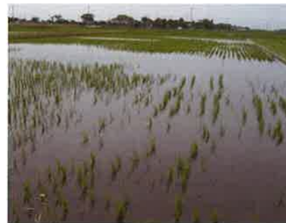
食害を受けた水田