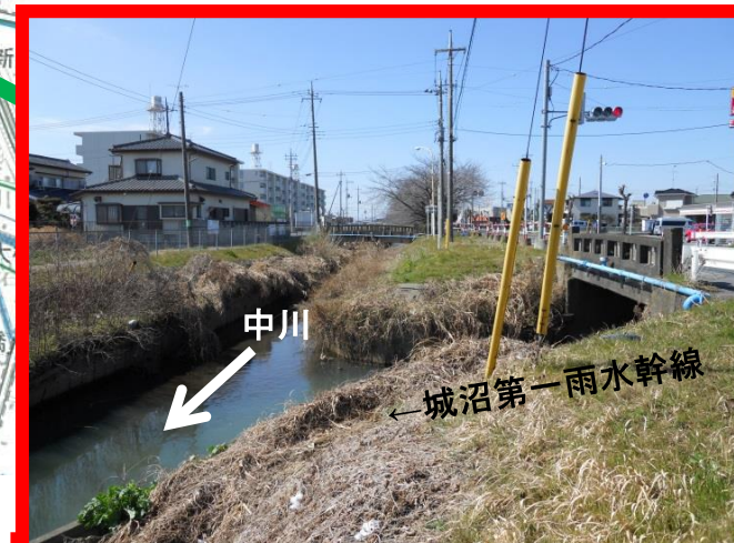
中川未整備区間 城沼雨水幹線合流部