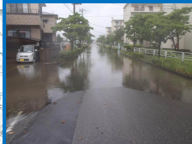
平成23年台風6号 城沼地区