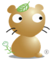
羽生市マスコットキャラクター 『ムジナもん』