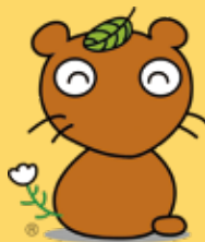
ムジナもん 羽生市

人権折り鶴「未来へ」、 人権の花、 人権ポスター、人権標語、 集会所・隣保館利用者の作品展示