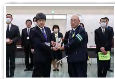
羽生市交通指導員連絡協議会より