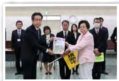
羽生市交通安全母の会より