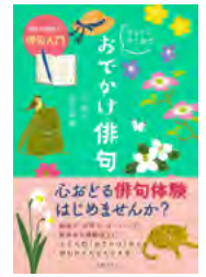
ちょっとそこまで おでかけ俳句 毎日が新鮮に! 俳句入門 (辻 桃子・如月真奈)