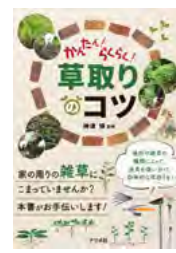
かんたん!らくらく! 草取りのコツ 大変な作業をできるだけ楽しく! (神津 博 / 監修)