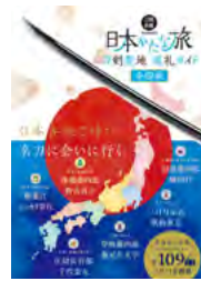
日本がたな旅 刀剣聖地巡礼ガイド 全国版 (ホビージャパン)