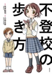
不登校の歩き方 (荒井裕司 / 編著、小林正幸 / 監修)