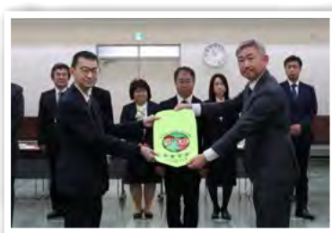
羽生交通安全協会より