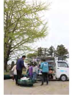
■表紙 「上川俣集会所の移動販売」