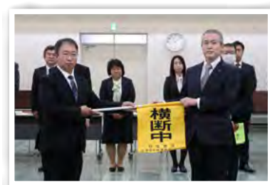
羽生地区交通安全 推進事業所協会より