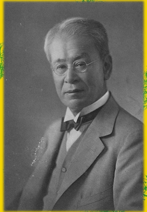
牧野富太郎