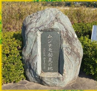
ムジナモ発見の地