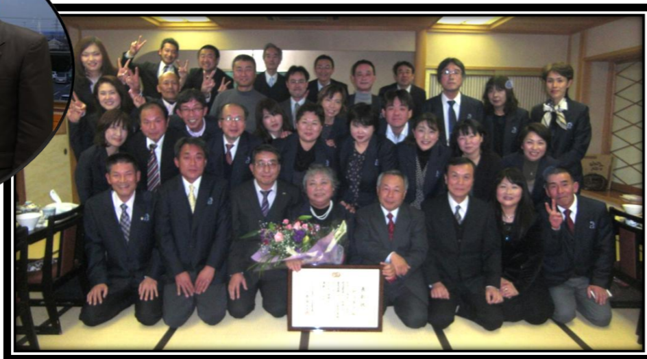
～平成23年度全国スポーツ推進委員連合優良団体表彰～ “羽生市スポーツ推進委員会” 受賞