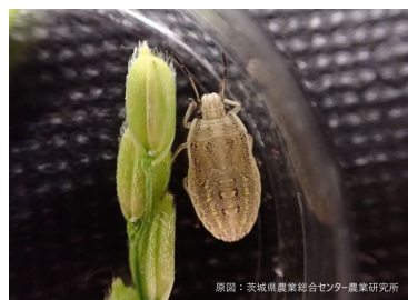
原図：茨城県農業総合センター-農業研究所