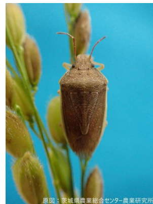
原図：茨城県農業総合センター-農業研究所