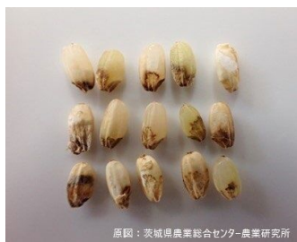
原図：茨城県農業総合センター-農業研究所