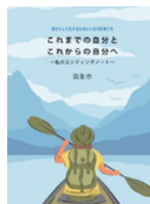
エンディングノート