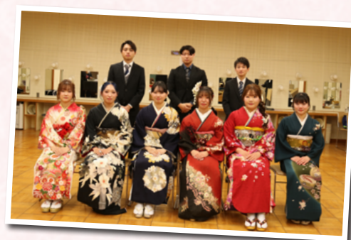
実行委員の皆さん