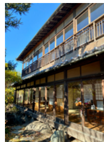
■表紙 「富田家住宅離れ 国文化財に登録」