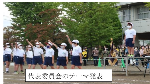
代表委員会のテーマ発表

また、翌日には代表委員会の企画で、運動会振り返り集会が開かれました。各クラスをリモートでつなぎ、感想発表や応援団からの振り返りがあり、それぞれの頑張りを認め合う会となりました。