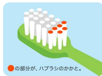
●の部分が、ハブラシのかかと。