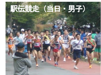
駅伝競走（当日・男子）

10月17日（月）行田市総合運動公園にて「北埼玉地区中学校駅伝競走大会」が開催されました。行田、加須、羽生3市の中学校が揃い、本校からは選手17名が参加、男子13位、女子10位（入賞）と健闘してくれました。選手の奮闘努力を称えたいと思います。