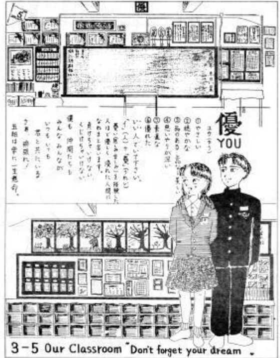
当時の学級の生徒が描いてくれたホームルーム教室のカット (卒業文集から)

私が教職に就いたのは、今から38年前、昭和の最後60年代です。全国的に校内暴力が社会的な問題となっていた頃です（おかげで教師として色々な体験をさせていただきました）。若かった私は、当時の中学生とコミュニケーションを取ろうと躍起になっていました。「どうしたら彼等と理解し合い、落ち着いた生活を送ることができるのだろうか？」授業者として、担任として、押しついたり引いたり、指導の試行錯誤を繰り返しました。当時の私は、お世辞にも指導力が高いとは言い難い教員だったと思います。毎日毎日、生徒への言葉かけや授業等での指導の在り方を考え、実践を重ねましたが、なかなか思うような指導はできませんでした。万策尽き果て、悩み、自身の指導力の低さを思い知り、せめて自分の学級の教室や教科の教室をどこよりもきれいにしようと、床、机、椅子、窓ガラスを拭き清め、掲示を工夫し、物品を整え、美しく機能的なレイアウトを心掛けました。毎日の放課後、教師の私一人が教室の清掃や整備を行っている、やがて一人、また一人、手伝ってくれる生徒が現れました。数日後には学級の生徒の大半が放課後に自主的に清掃を行うようになっていました。その後、自分たちの生活空間である教室を乱雑に放置したり、壊してしまったりする生徒は一人もいなくなりました。そして日常の学級生活でも、授業でも、自然と私の指導を受け止めてくれるようになりました。彼等は20代の私に「生徒は教師の指導力を映し出す鏡」のような存在であることを教えてくれた子たちでした。以来、具体的な指導を行う以前に、自分の勤めている学校を美しく機能的に整え、生徒たちが主体的に学ぶことができる学習空間の創出を第一に考えるようになりました。今でもそのように考えています。