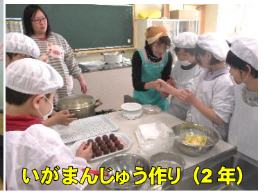
いがまんじゅう作り(2年)