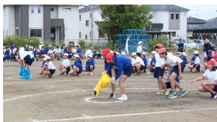
【高学年・団体種目】