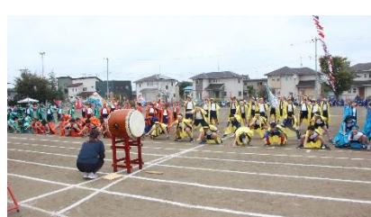
【中学年・表現種目】