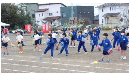
【低学年・表現種目】