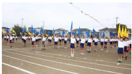
【高学年・表現種目】