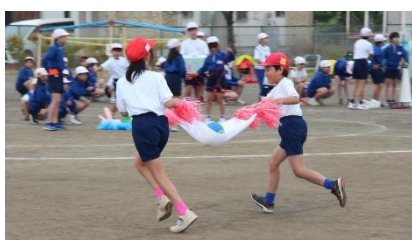
【中学年・団体種目】