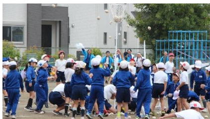
【低学年・団体種目】