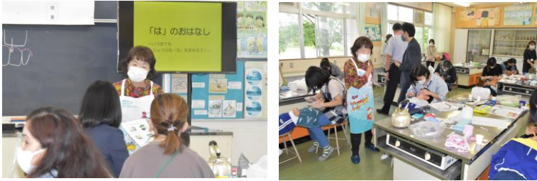
6/9 (金) 1年親子歯みがき教室 歯科衛生士の先生を講師として、1年生を対象に第1回学校保健委員会「親子歯みがき教室」を実施しました