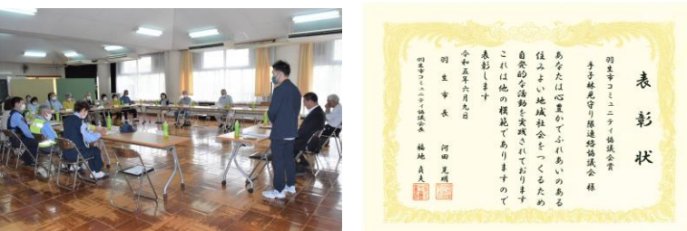
6/20 (火) 見守り隊連絡協議会 子供たちの登下校を毎日見守ってくださっている見守り隊の皆様の連絡協議会が行われました。また、この度、手子林見守り隊の活動が認められ、羽生市から「羽生市コミュニティ協議会賞」をいただきました。