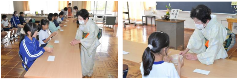
6/6 (火) 6年日本文化体験(茶道) 地域の方を指導者にお招きし、6年生が総合的な学習の一環として、茶道体験を実施しました。