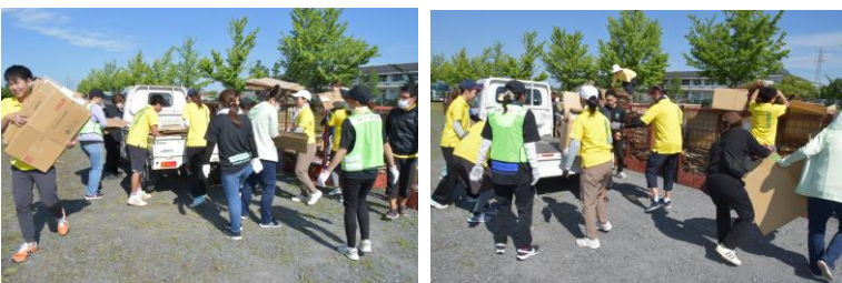
6/17 (土) 第1回PTA資源回収 今年度1回目のPTA資源回収を実施しました。保護者・地域の皆様、ご協力ありがとうございました。