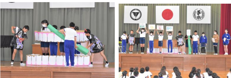
6/14 (水) 児童集会 児童集会で保健委員会の児童が「継続は力なり」をテーマに、歯みがきの大切さについて発表しました。